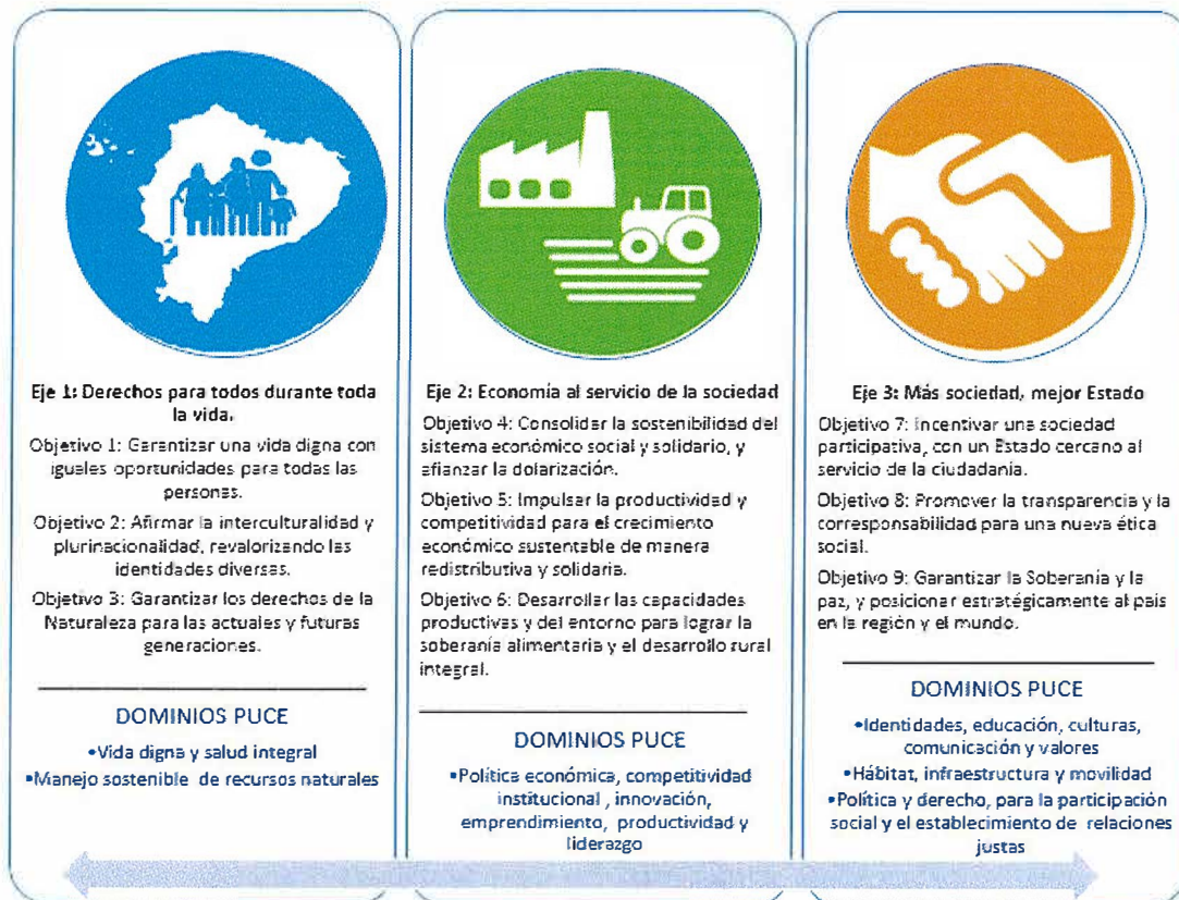
Figura 2. Dominios Académicos PUCE – 2017 relación Plan Nacional de Desarrollo 2017 – 2021 Fuente: Plan Nacional de Desarrollo 2017 – 2021 Elaboración: Dirección de Investigación 2017